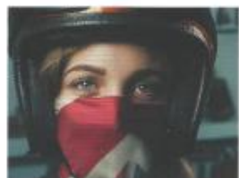
DOSSIER MATOS CÔTÉ GARAGE, CÔTÉ PODIUM