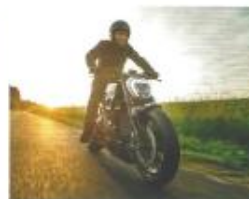
DUCATI X DIAVEL LE BON COUP DE KRUGGER