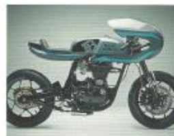
CUSTOM-FACTORY PRÉPAS DE CONSTRUCTEURS