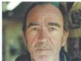
SIXTH STREET SPECIALS LE ROI DE NEW YORK