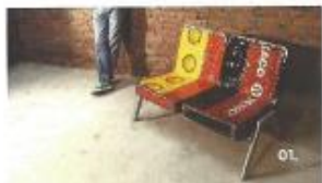
01. GERARD, plutôt Shell ou Texaco? 02. ONO, un bahut aux couleurs Eiff. 03. BIDORA, version siamoise de la chaise DORA.