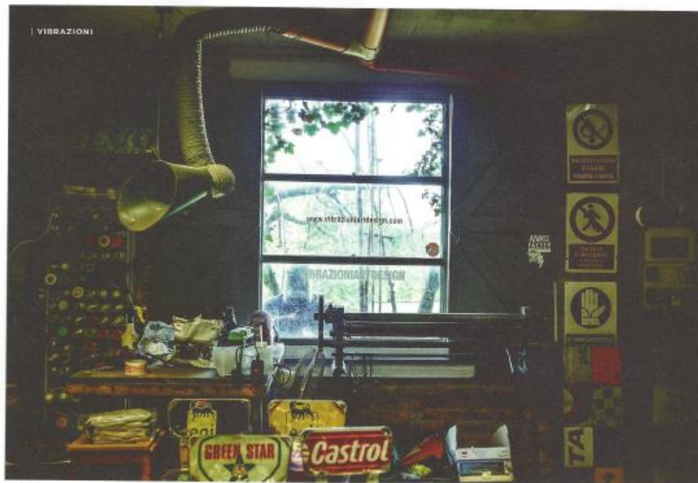
Les Vibrazioni Art Design travaillent dans une grange familiale, dans la campagne romagnole, entre Imola et Ravenna.

Tôles d'acier, couleurs vives, rouille. Le bleu de la flamme du poste à souder, le rouge et le jaune des étincelles. Et le vert tout autour de l'atelier, le silence des champs, l'air et les odeurs de la Romagne, la terre des moteurs. Chez Vibrazioni Art Design, à Massa Lombarda, à quelques litres d'essence seulement d'Imola, la moto revient savourer ses origines d'objet expérimental et imparfait, grossier et charmant en même temps. Vibrazioni Art Design est une réalité italienne unique dans son genre. Dans les salons du mobilier et de la déco, on les appelle "les gars des motos" ; sur les événements moto, ils deviennent "ceux des fauteuils"... Mais ça va plus loin que ça.